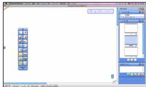
図2：StarBoard Software の画面例

以前のバージョンからユーザーインターフェースを大きく変更し、今まで以上に直観的な操作を実現しました。ナビゲーションを分かりやすく配置し、直感的に理解できるユーザーインターフェースとなりました。