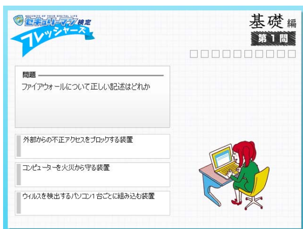
図1：基礎編問題画面